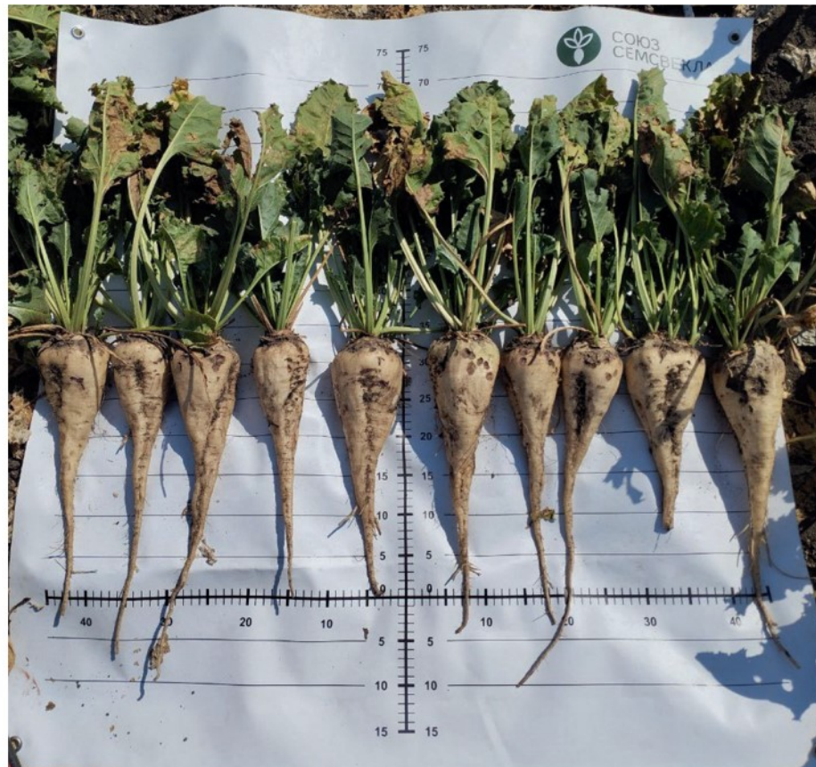
Гибрид сахарной свеклы Бриз: 1. Ставропольский край, 2. Белгородская область

Результаты полевых испытаний гибрида сахарной свеклы Бриз, 2022 год