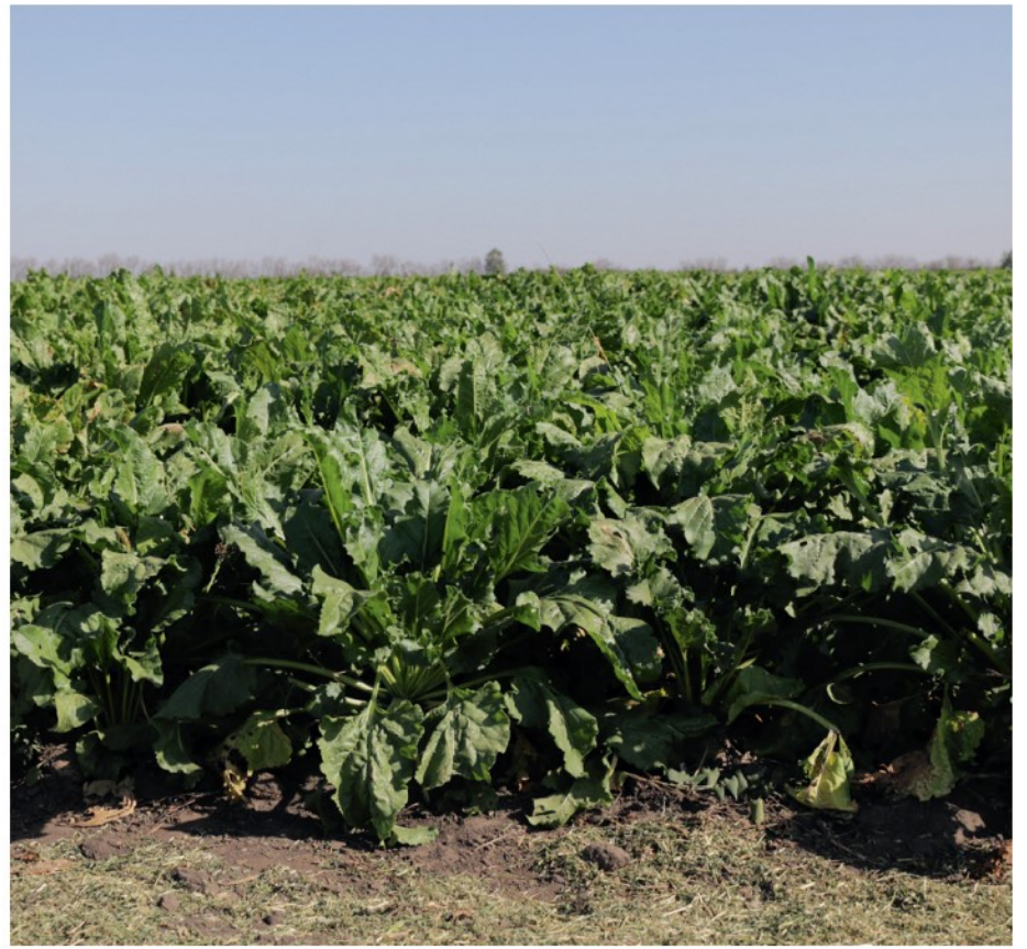
Гибрид сахарной свеклы Айсберг: 1, 2. Орловская область